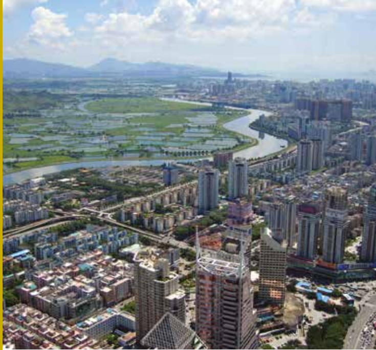
Pemandangan Shenzhen dari udara, Tiongkok