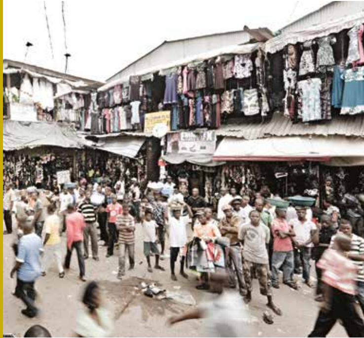
Pasar terbuka di Onitsha, Nigeria