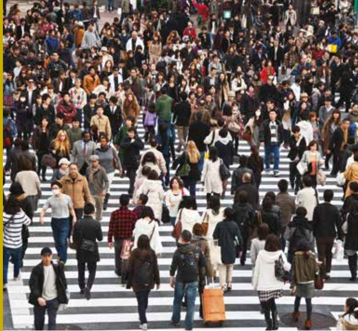
Pejalan kaki di Tokyo, Jepang

Perencanaan kota dan wilayah dapat berkontribusi untuk pembangunan berkelanjutan dalam berbagai cara. Ini terkait erat dengan tiga dimensi yang saling melengkapi pembangunan berkelanjutan: pembangunan sosial dan inklusi, pertumbuhan ekonomi yang berlanjut, serta perlindungan dan pengelolaan lingkungan.