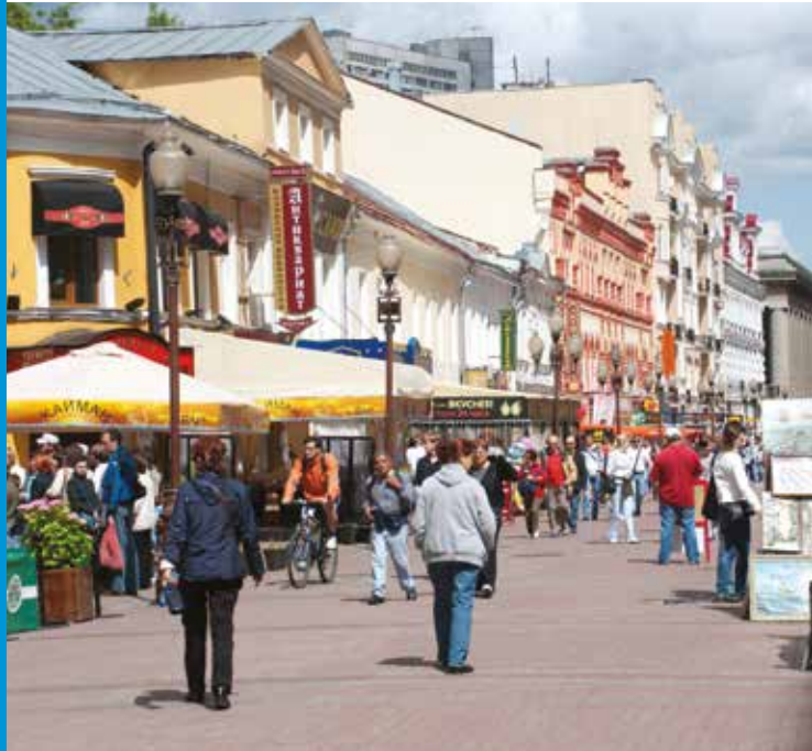
Jalur pejalan kaki di Moscow, Rusia