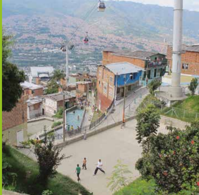
Espace public à Medellín, Colombia