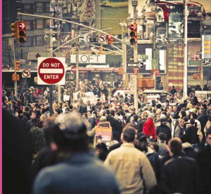
Rue à New York, États-Unis d'Amérique