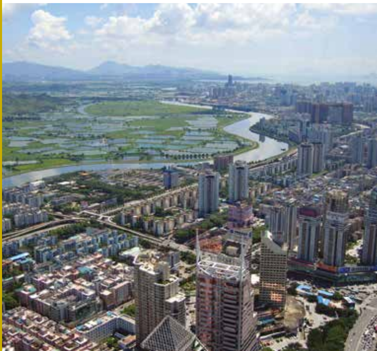
Vue aérienne de Shenzhen, Chine