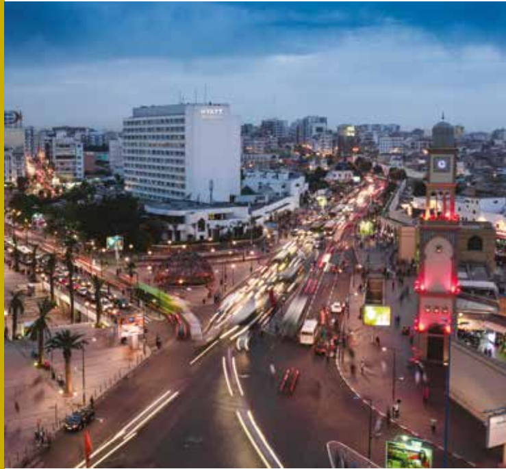
Place des Nations Unies à Casablanca, Maroc