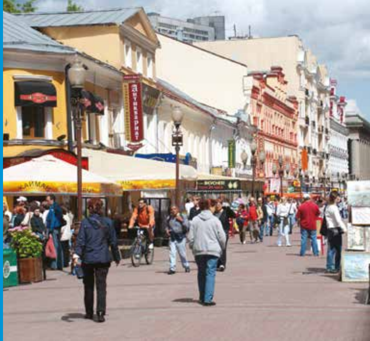
Rue piétonne à Moscou, Russie