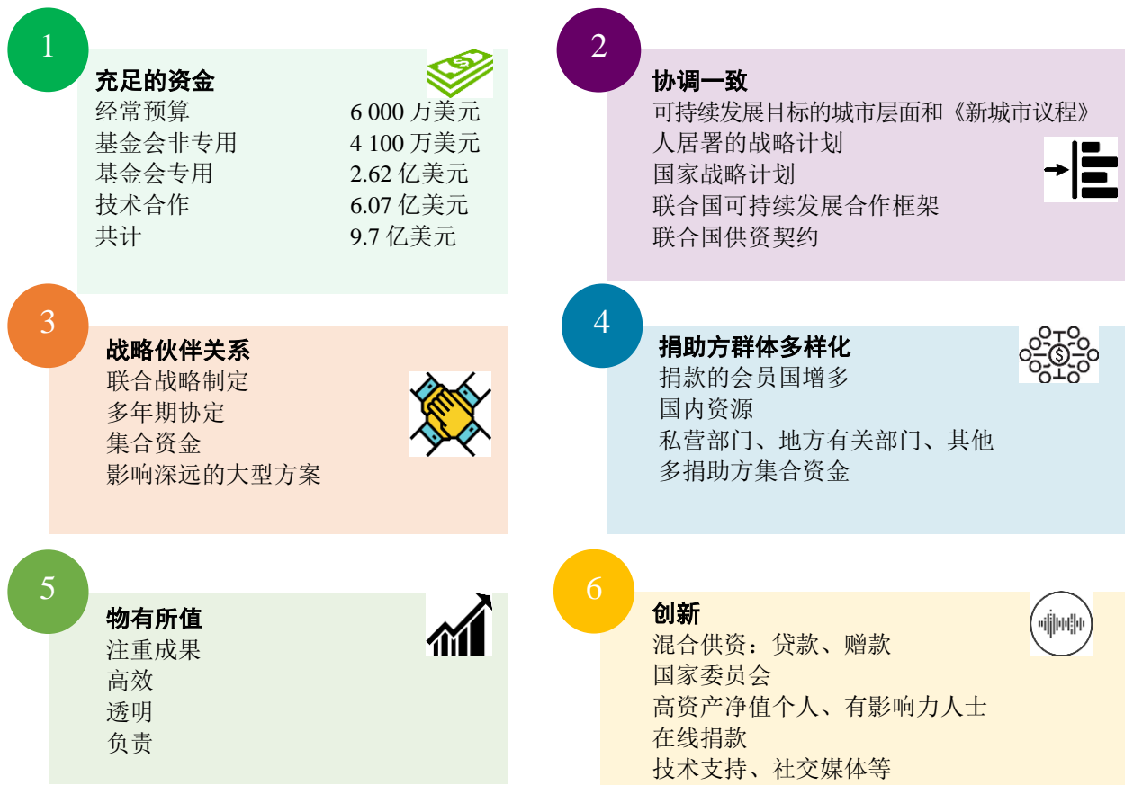
图 1 人居署资源调动战略的目标

4. 2021 年 6 月，执行局要求今后关于资源调动战略执行情况的报告应包括与实现资源调动战略目标有关的事实和分析资料。