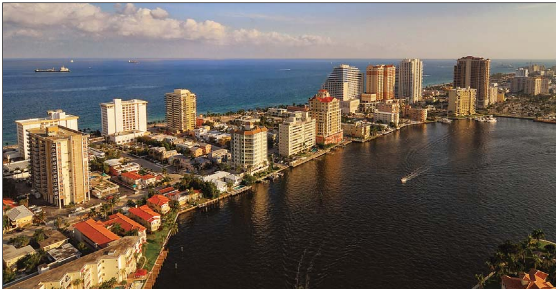
Городам придется адаптировать прибрежные жилые и коммерческие застройки к последствиям изменения климата