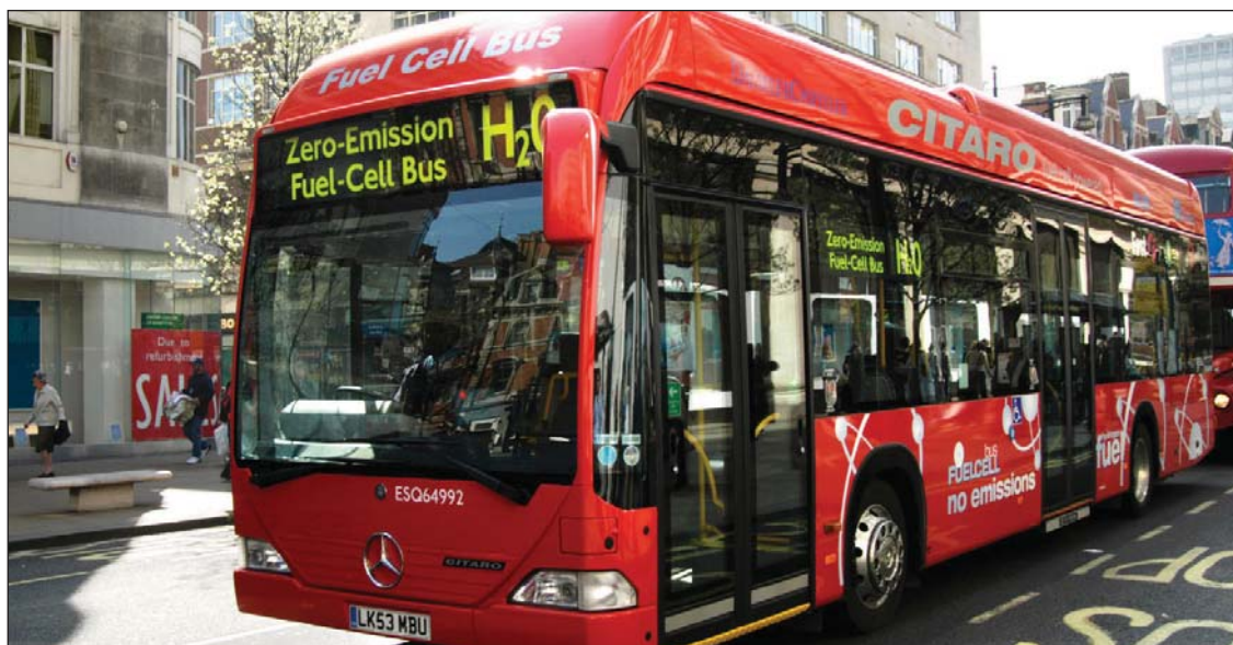
Регламентирование деятельности по продвижению энергосберегающего транспорта могут снизить выбросы ПГ