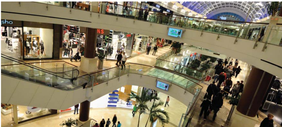
Растущее потребление городской элиты стимулирует рост выбросов ПГ