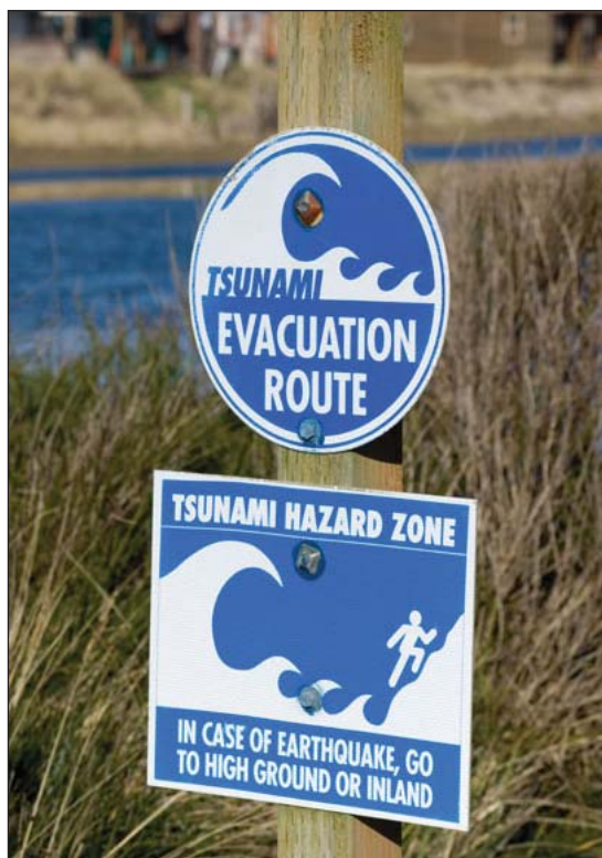
Уязвимость городов к изменениям климата будет зависеть от степени их подготовленности