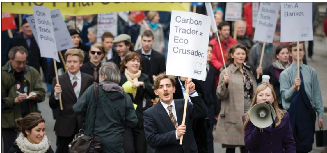
Все чаще звучат требования к правительствам принять меры в ответ на изменение климата