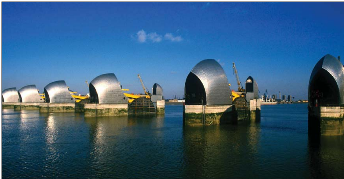
Городам придется инвестировать в инфраструктуру для адаптации к изменению климата