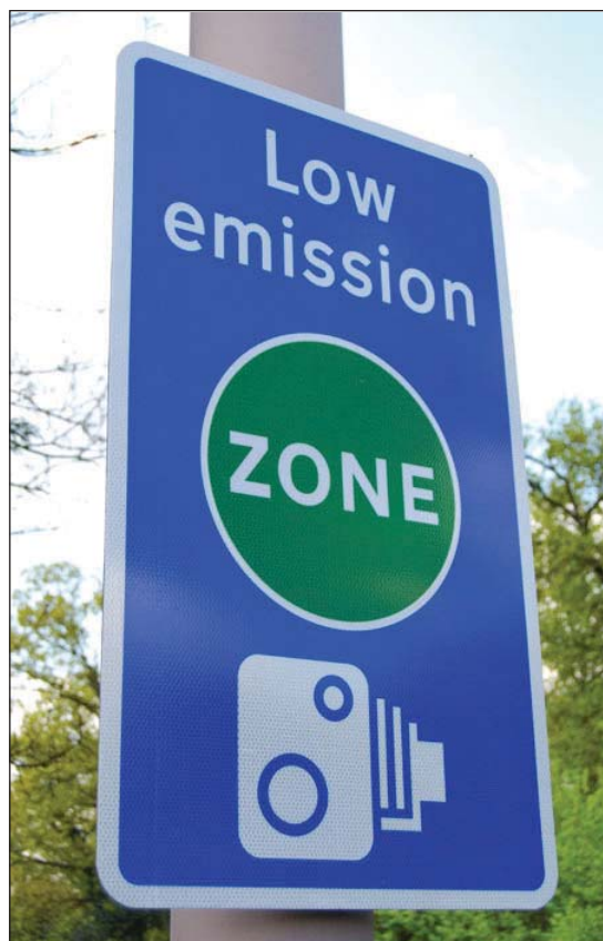
Принуждение к ограничению выбросов – ключевая задача в городах

В течение последних 20 лет муниципальные власти и другие заинтересованные лица участвовали в разработке городских программ по смягчению последствий изменения климата, а также выдвигали инициативы и разрабатывали процессы с целью снижения выбросов ПГ в городах. Муниципалитеты принимали немедленные меры по снижению выбросов ПГ, исходя из имеющихся у них возможностей, часто действуя по принципу реагирования: например, в ответ на гранты или чьи-то инициативы. Они также разра-