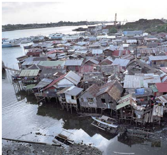
Последствия изменения климата скажутся на малообеспеченном городском населении непропорционально