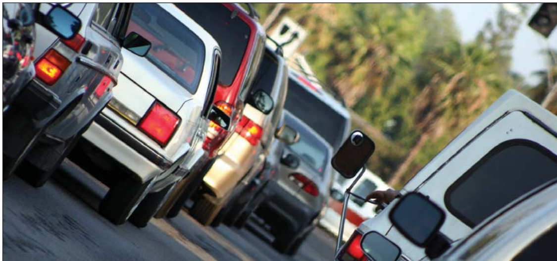
Повышенная зависимость от личного автотранспорта становится основным источником выбросов ПГ в городах.