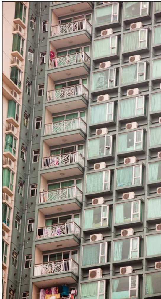
Кондиционирование зданий повышает потребление энергии

Как уже было сказано выше, городские территории в различных странах и даже в пределах одной страны, имеют различные показатели выбросов, в зависимости от экологических, экономических, социальных, политических и юридических аспектов на местном