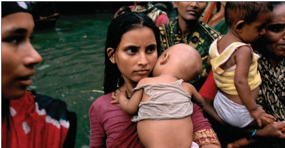
Бедные женщины и дети наиболее уязвимы перед последствиями стихийных бедствий