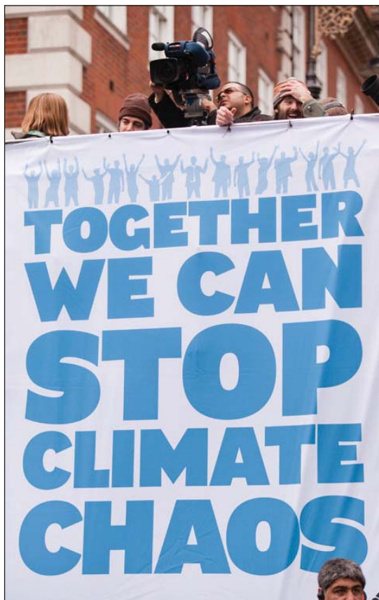
Городам необходимо привлекать все заинтересованные стороны для реагирования на изменение климата

Таким образом, решение экологических вопросов может послужить катализатором для социально открытого, экономически продуктивного и природохранного городского развития, что выведет сотрудничество между заинтересованными лицами и их участие в решение проблем на новый уровень.