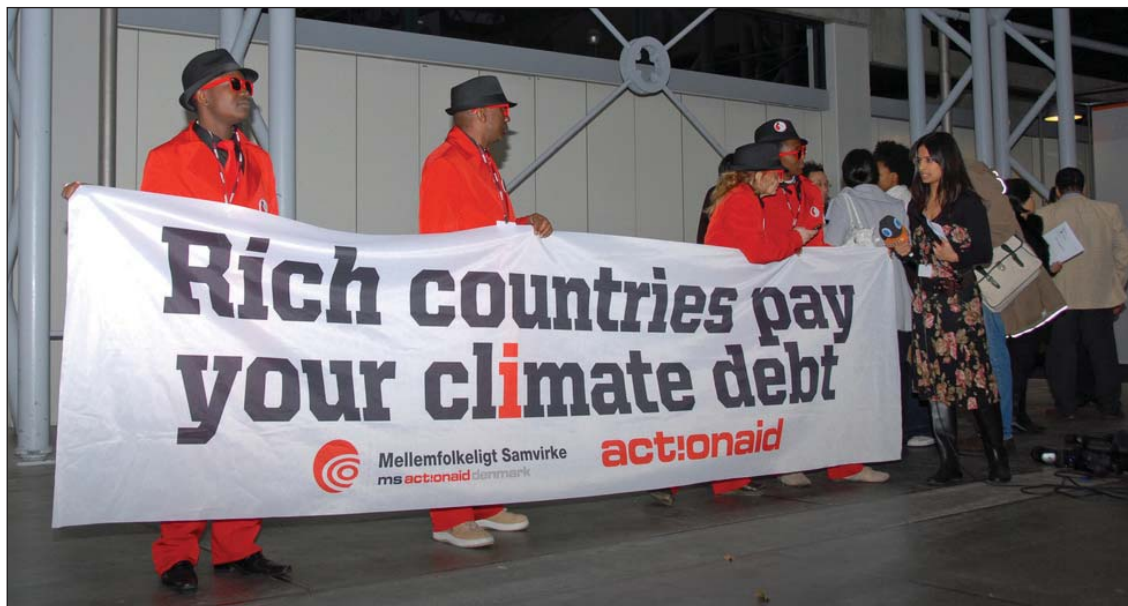
Основной груз ответственности в борьбе с глобальным потеплением лежит на развитых странах