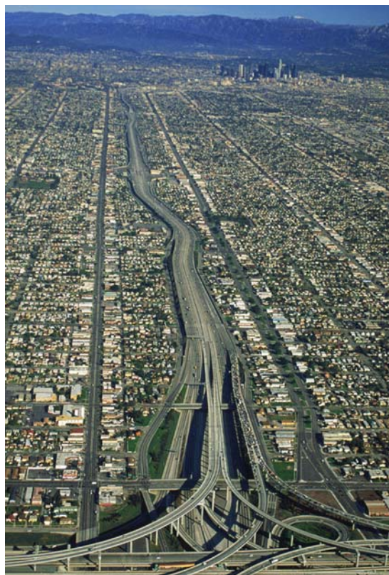
Разрастание городов вносит вклад в повышение выбросов ПГ

рали ключевую роль в этом процессе, хотя масштаб их роли еще до конца не осознан.