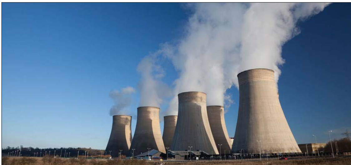
Городское потребление стимулирует промышленное развитие и выбросы ПГ