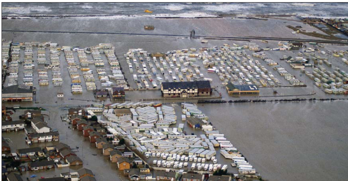
Повышение уровня моря – серьезная проблема для прибрежных городов