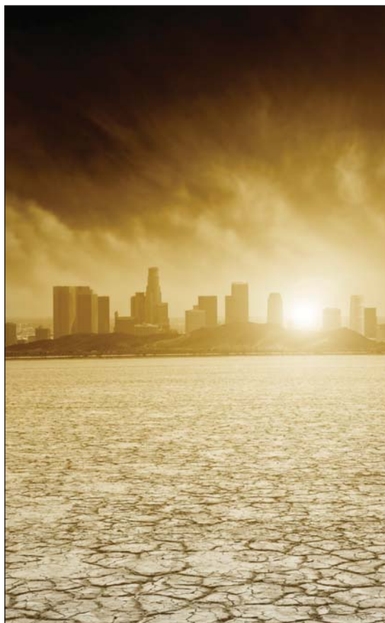
Урбанизация и климат сочетаются опасным образом.

В то время как некоторые города сокращаются по площади, во многих городских центрах наблюдается скоротечное и преимущественно неконтролируемое увеличение населения, что создает модель быстрой урбанизации. Такой рост в настоящее время происходит преимущественно в развивающихся странах и сконцентрирован в неформальных поселениях и трущобах. Таким образом, те самые городские районы, которые разрастаются наи-