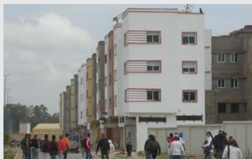
Carrières centrales et Lahraouiye