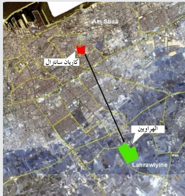
الهراوين على بعد 13 كلم من كاريان سنترال