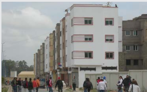
كاريان سنترال والهراوين