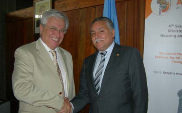
السيد جوان كلوس (يسار)، المدير التنفيذي لبرنامج الأمم المتحدة للمستوطنات البشرية والسيد نبيل بنعبد الله، وزير السكنى والتعمير وسياسة المدينة

انعقدت الدورة الرابعة للمؤتمر الوزاري الإفريقي حول الإسكان والتنمية الحضرية في نيروبي بكينيا ما بين 20 و23 مارس 2012. وتأتي هذه الدورة بعد الدورات التي انعقدت في كل من دوربان (2005)، أبوجا (2008) وباماكو (2010). ويعد المؤتمر الوزاري الإفريقي للإسكان والتنمية الحضرية هيئة بينحكومية ذات طابع استشاري تهدف إلى تشجيع التنمية المستدامة في المدن الإفريقية، تم تأسيسها بمبادرة من الاتحاد الإفريقي وبرنامج الأمم المتحدة للمستوطنات البشرية. إنها الهيئة الإفريقية الوحيدة بينحكومية التي تعنى بالمدينة.