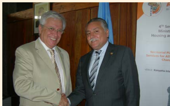
M. Joan Clos (à gauche), Directeur exécutif d'ONU-Habitat, et M. Nabil Benabdallah, ministre de l'Habitat, de l'Urbanisme et de la Politique de la Ville

L'allocution de M. Nabil Benabdallah, Ministre de l'Habitat, de l'Urbanisme et de la Politique de la Ville, avait pour thème : L'accès équitable au sol, au logement et aux équipements de base, l'expérience du