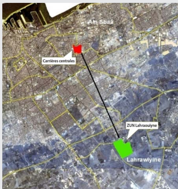
Lahraouiye est à 13 kilomètres des Carrières centrales