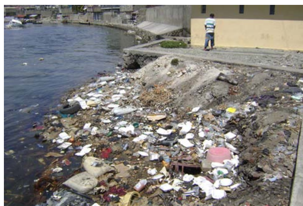
Décharge sauvage dans le port.