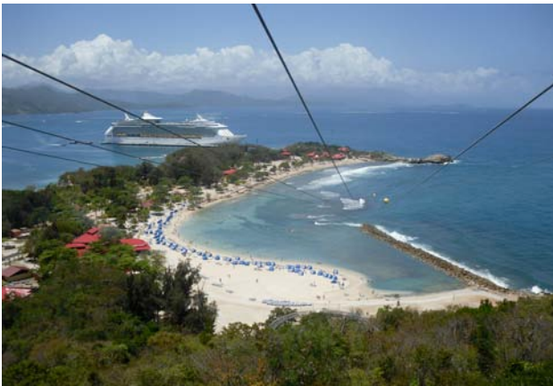
Site touristique de Labadie à proximité du Cap-Haïtien.

6,6 % des unités informelles disposent d'un local spécifiquement réservé à l'exercice de l'activité (marchés publics, ateliers). Les autres se répartissent entre la voie publique (37,8 %) et le domicile (55,7 %), là encore sans local spécifique dans la majorité des cas. La branche d'activité dominante est le commerce (tous commerces de produits primaires et manufacturés confondus). C'est le cas pour 53,7 % des unités, 74,4 % du chiffre d'affaires et 57,5 % de la valeur ajoutée réalisée. Par ailleurs, la plupart des unités se caractérisent par de faibles immobilisations d'actifs (locaux, équipements, machines, et autres outillages, etc.).