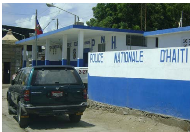
Commissariat du Cap-Haïtien.

Les quartiers de Vertières et de Sainte-Philomène sont des zones difficiles qui hébergent la majorité des populations migrantes. Après les inondations des Gonaïves, il y a bientôt cinq ans, 45 % de la population de cette ville a migré vers le Cap-Haïtien qui n'était absolument pas préparée à accueillir ni à intégrer ce flux massif de nouveaux venus.