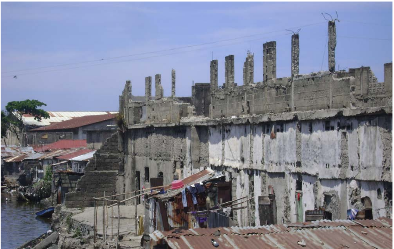
Bâtiment en reconstruction suite au tremblement de terre de 2010.

Cap-Haïtien est une ville naturellement à risque de part sa situation en bord de mer. La ville a déjà été frappée par de graves catastrophes dont un tremblement de terre en 1842 qui a secoué le nord de l'île. Par la suite, une inondation s'est produite en 1963 et plus récemment en novembre 2000 suite au passage du cyclone Georges. La ville est sous la menace constante de raz-de-marée, spécialement au niveau de la zone nan ranblè, dans la localité de Petite-Anse. Par ailleurs, la ville fait face à de sérieux risques de glissements de terrain pendant les périodes de fortes pluies qui ont déjà fait de nombreux morts.