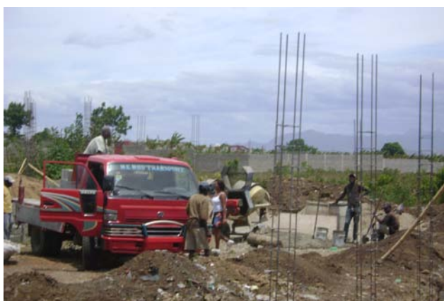
Construction de nouveaux quartiers en périphérie de la ville.

La problématique urbaine de la ville du Cap-Haïtien est liée à sa situation « d'enfermement » physique qui rend extrêmement difficile le réaménagement des espaces de vie. Penser urbanisme, c'est essayer de voir comment donner à chacun le ou les moyens de vivre dans la ville. Puisque le développement spatial est bloqué par les mornes, et que tous les services sont au centre, il y a nécessité à équiper la ville.