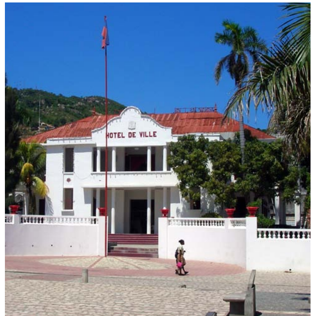
Hôtel de ville du Cap-Haïtien (© Rémi Kaupp, CC-BY-SA, Wikimedia Commons).

Les femmes sont faiblement représentées au sein du cartel avec 2 femmes sur les 9 élus. Les questions d'équité entre les sexes sont prises en compte par l'administration communale sans pour autant être une priorité. Cependant, vu le poids économique et social de la femme dans la société, elle demeure un interlocuteur privilégié, sans pour autant se sentir considérée dans la gouvernance de la ville. Les organisations de femmes sont toutefois très présentes et très actives.