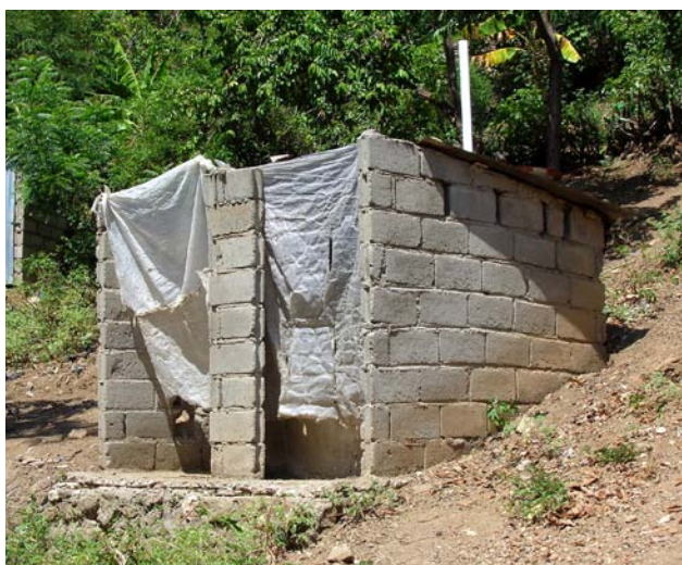
Latrine publique (© Rémi Kaupp, CC-BY-SA, Wikimedia Commons).

Les services publics de collecte des déchets solides sont fournis par la mairie et par le ministère des Travaux publics, transports et communications à travers son service métropolitain de collecte des résidus solides. Le matériel et les moyens logistiques sont en quantité nettement insuffisante pour remplir cette mission et peu de dispositions institutionnelles ont été prises en vue d'apporter une amélioration à la salubrité des villes. Le service formel de ramassage des ordures n'est présent que dans les principales villes du pays mais il est très peu fonctionnel. Toutefois, des compagnies privées s'occupent de collecter régulièrement les ordures ménagères de leur clientèle. La mauvaise gestion des ordures ménagères pose de sérieux problèmes sanitaires. Les déchets sont déversés dans les canaux de drainage, les égouts ou tout simplement déposés sur les trottoirs. Lors de fortes pluies, ces ordures bouchent les canaux d'évacuation des eaux. Dans les zones rurales, ces déchets sont transformés en fumier et utilisés comme engrais pour l'agriculture. Toutefois cette pratique comporte un sérieux problème pour la santé des riverains, car elle engendre la pollution du milieu naturel, y compris l'air ambiant.