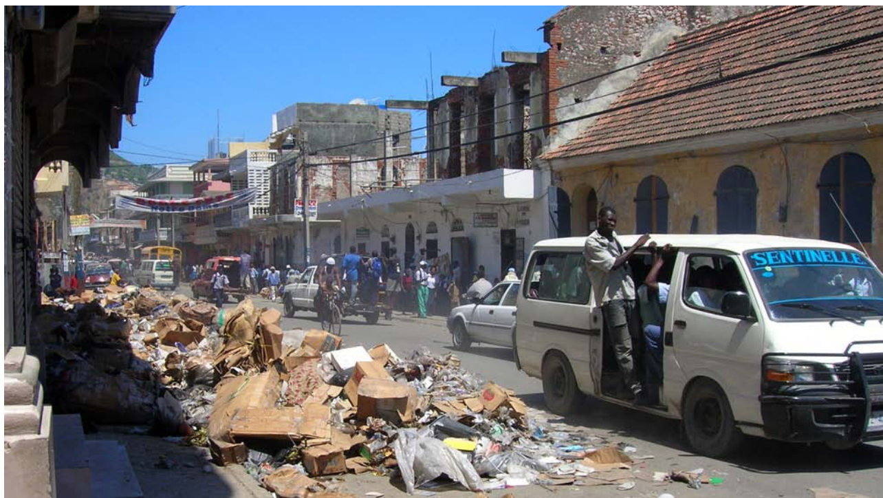
L'Avenue espagnole, une des principales artères du Cap-Haïtien, près du marché.