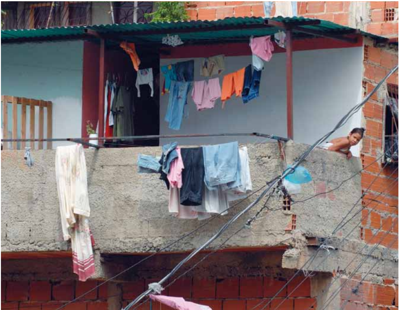
El rápido crecimiento de la población en ciudades como Caracas, la capital de Venezuela, ha aumentado la demanda de viviendas. Muchos jefes de familias pobres se ve afectado por la falta de viviendas adecuadas, localización inconveniente, y escaso acceso a agua limpia, electricidad, transporte público y otros servicios vitales.