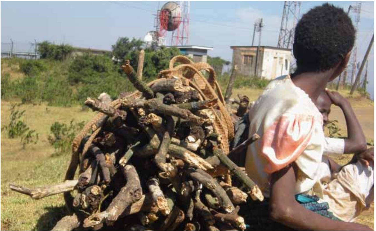
Las mujeres representan una gran proporción de los pobres que miran hacia las ciudades en busca de una vida mejor. Foto © Caylee Hong, Ngong Hills, 2009 / ONU-HABITAT.