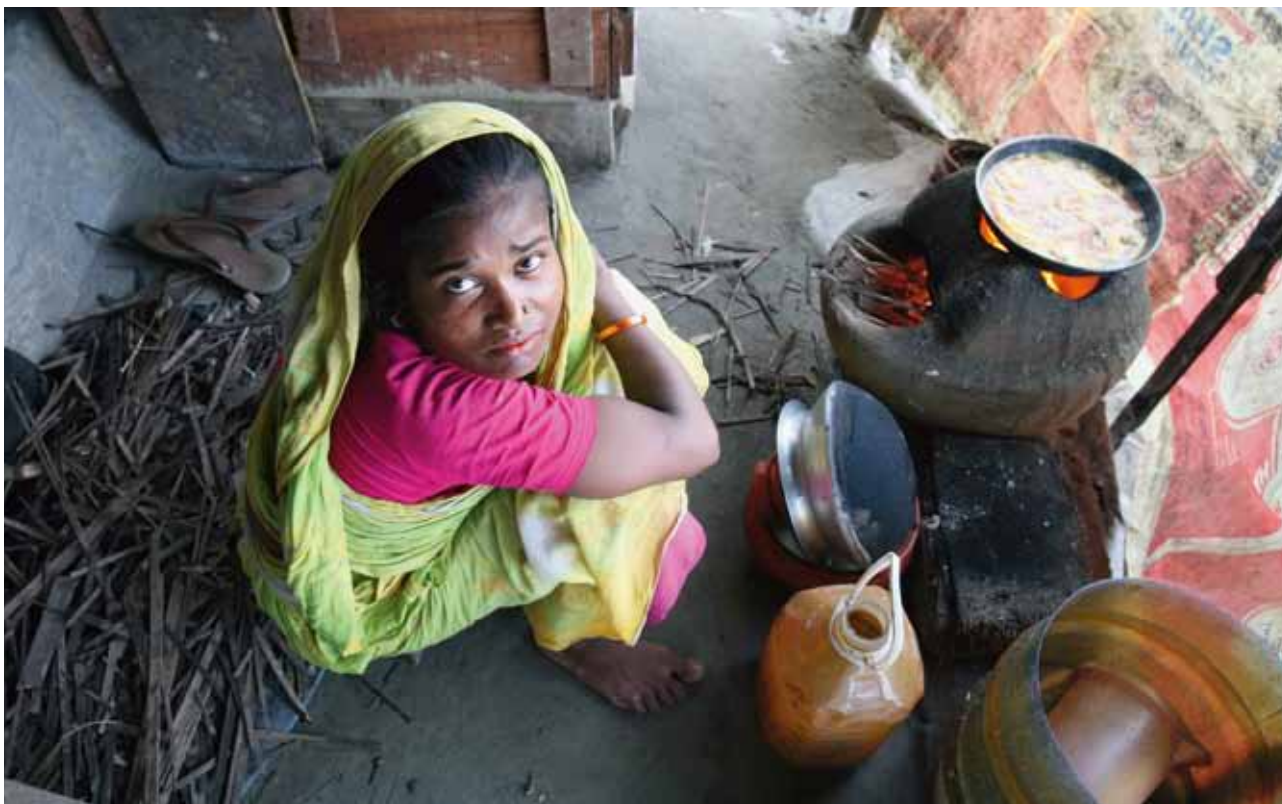
Las mujeres pueden ser actores clave para la promoción de prácticas ambientalmente más adecuadas sobre el uso de combustible, construcción de casas y disposición de desperdicios.

Desde 1975, el número de desastres naturales registrado (incluyendo aluviones, tsunamis, ciclones tropicales, terremotos e inundaciones) aumentó cuatro veces. 51 Se considera que siete de cada 10 desastres naturales se relacionan con el clima, 52 como sequía, desertificación, tormentas severas, huracanes y deslizamientos de tierra. La población pobre urbana es vulnerable, dado que muchos viven en zonas proclives a inundaciones y en áreas ambientalmente peligrosas. La baja calidad de las viviendas constituye una amenaza más a sus posibilidades de supervivencia.