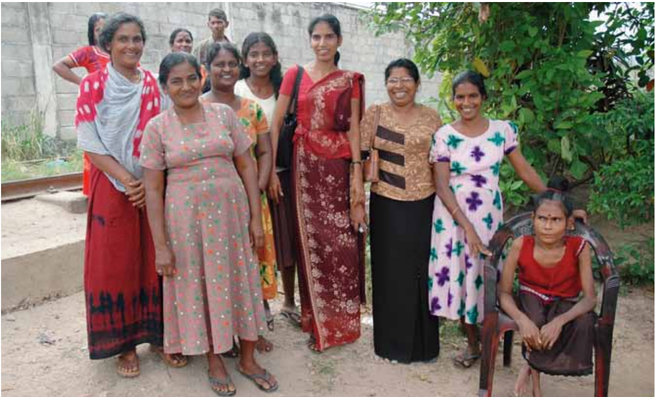
Los pequeños grupos de ahorros de mujeres que viven en asentamientos informales en Sri Lanka pudieron obtener préstamos accesibles para mejorar sus casas o instalaciones comunitarias, por medio de la colaboración con las autoridades locales y con ONU-HABITAT. Colombo, Sri Lanka.