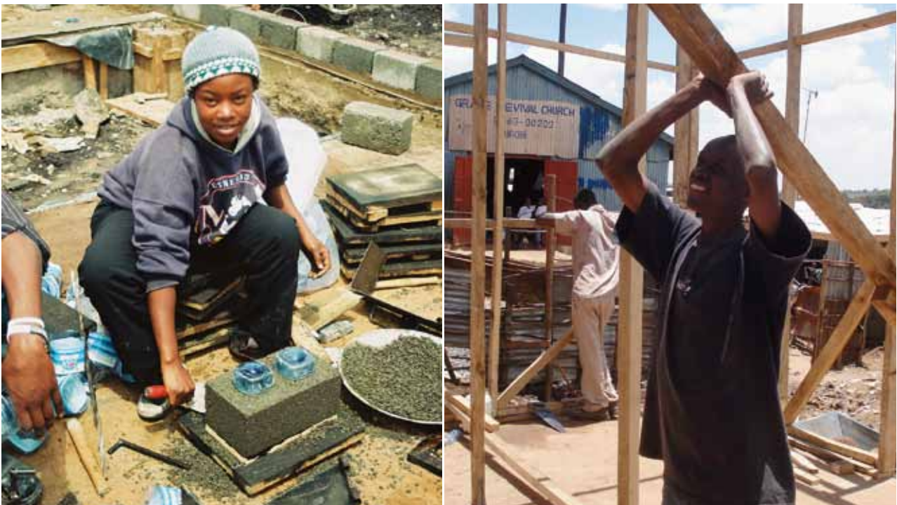
ONU-HABITAT trabajó con el gobierno de Kenia para establecer el Centro de Capacitación para la Juventud Moonbeam, que entrena a jóvenes en habilidades constructivas y de negocio.

— Informe sobre la Juventud Mundial 2007 de las Naciones Unidas