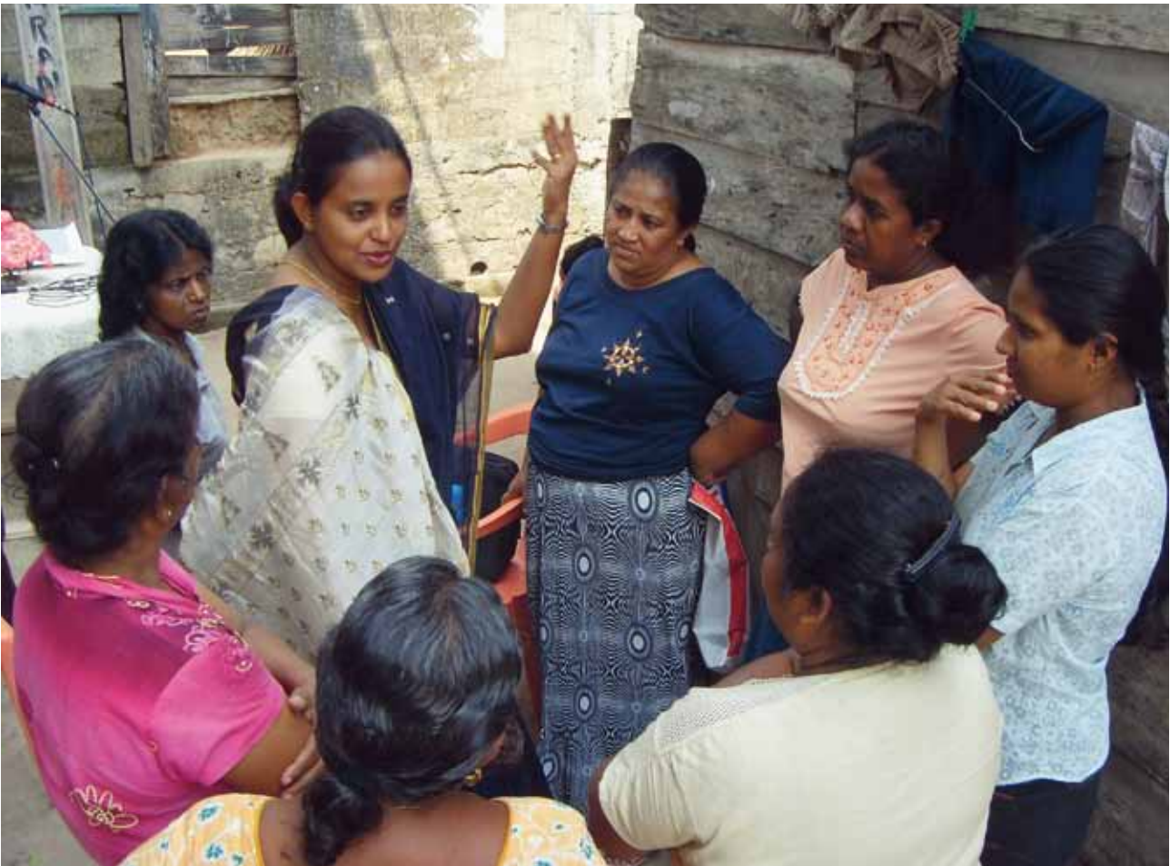
La labor de ONU-HABITAT en lo que hace a la financiación para la vivienda está ayudando a las mujeres y a sus familias en Kuruniyawatta, Sri Lanka, a fin de construir mejores casas, resistentes a las inundaciones. El distrito se encuentra en la llanura anegable del río Kelani.

ONU-HABITAT hace esfuerzos para asegurar que las mujeres disfruten de acceso igualitario a financiamientos accesibles para la vivienda e infraestructura básica, especialmente en asentamientos precarios y áreas urbanas pobres. La agencia ha involucrado a mujeres tanto como planificadoras de proyecto y beneficiarias, al establecer Instalaciones de Financiamiento Local en Ghana, Indonesia, Sri Lanka y Tanzania. (Ver estudio de caso sobre el Banco de Mujeres de Sri Lanka en la página siguiente.)