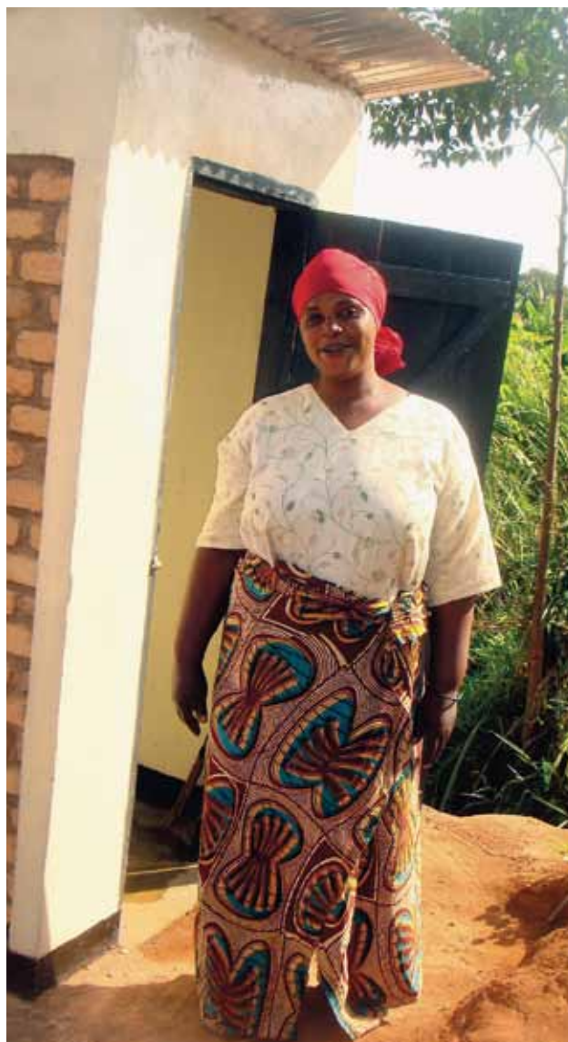
Para las mujeres, los servicios sanitarios constituyen un asunto de salud y de dignidad humana.

Hasta el momento, las constataciones de género se han completado en tres pueblos en Laos y en cuatro ciudades en el estado de Madya Pradesh, India. Esto ha sido de utilidad para las autoridades locales en su tarea de verificar las necesidades locales y para preparar sus propias estrategias sobre género y planes de acción.