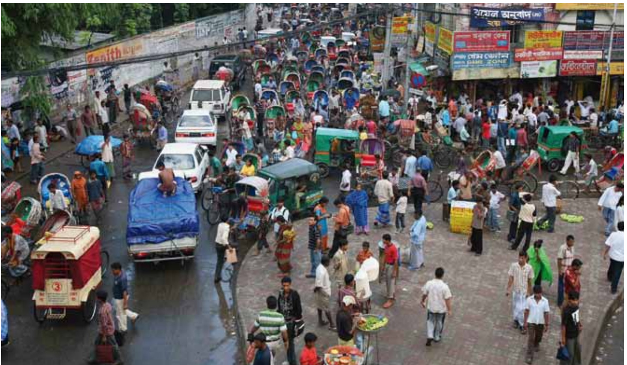
Cada semana, 3 millones de personas llegan a las ciudades del mundo en desarrollo. La lucha por igualdad de género en pueblos y ciudades de todo el mundo tiene lugar de forma creciente. Foto © Caylee Hong, Ngong Hills, 2009 / ONU-HABITAT.