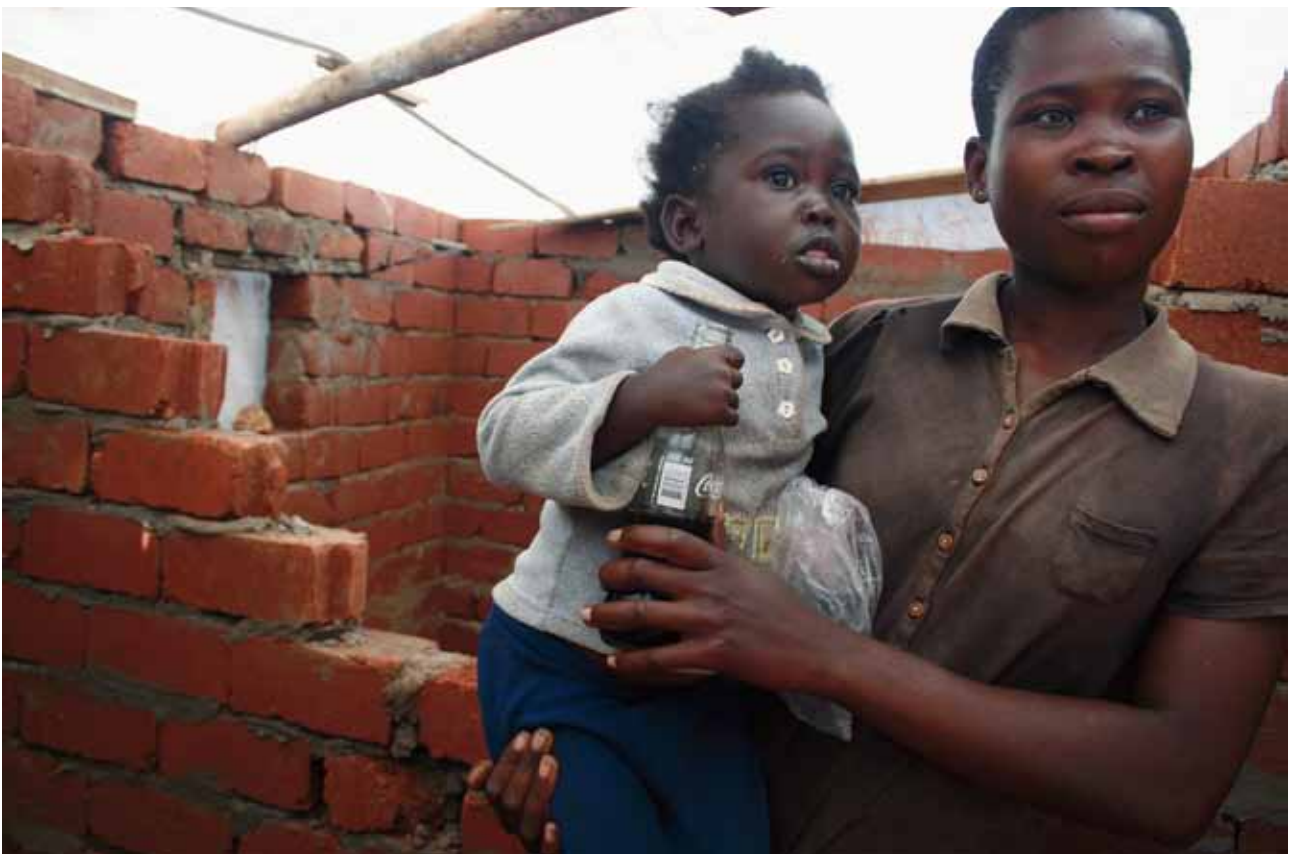
ONU-HABITAT está ayudando a las mujeres a encontrar soluciones accesibles para financiar mejores viviendas.

Además de préstamos accesibles para la vivienda, los fondos brindan también a las mujeres asesoramiento comercial y capacitación, permitiéndoles maximizar los ingresos y hacer buen uso de los pequeños préstamos para fondos rotativos. Los fondos también facilitan a las mujeres vinculación con las autoridades locales en temas tales como suministro de suelo, agua y saneamiento.