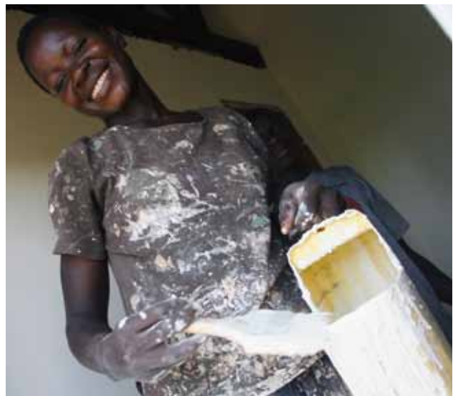
Las mujeres poseen mucho potencial inexplorado para mejorar las respuestas frente a los desastres y esfuerzos de reconstrucción.

La promoción de la igualdad de género en el alivio humanitario y en los esfuerzos de reconstrucción continua siendo un reto constante, dado que muchas comunidades, e incluso gobiernos, no lo consideran