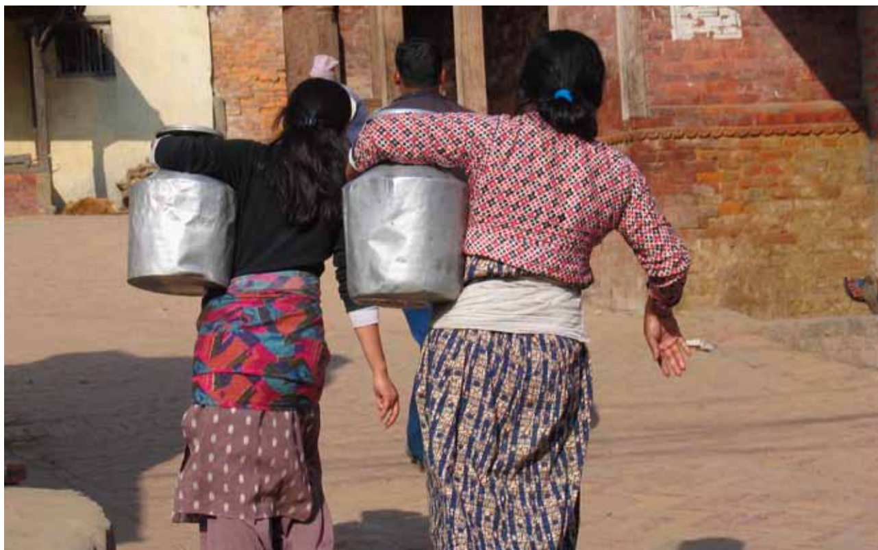
ONU-HABITAT está trabajando con las autoridades locales, redes de mujeres, grupos comunitarios y expertos en agua y servicios de saneamiento con el fin de desarrollar mejores instalaciones y servicios.