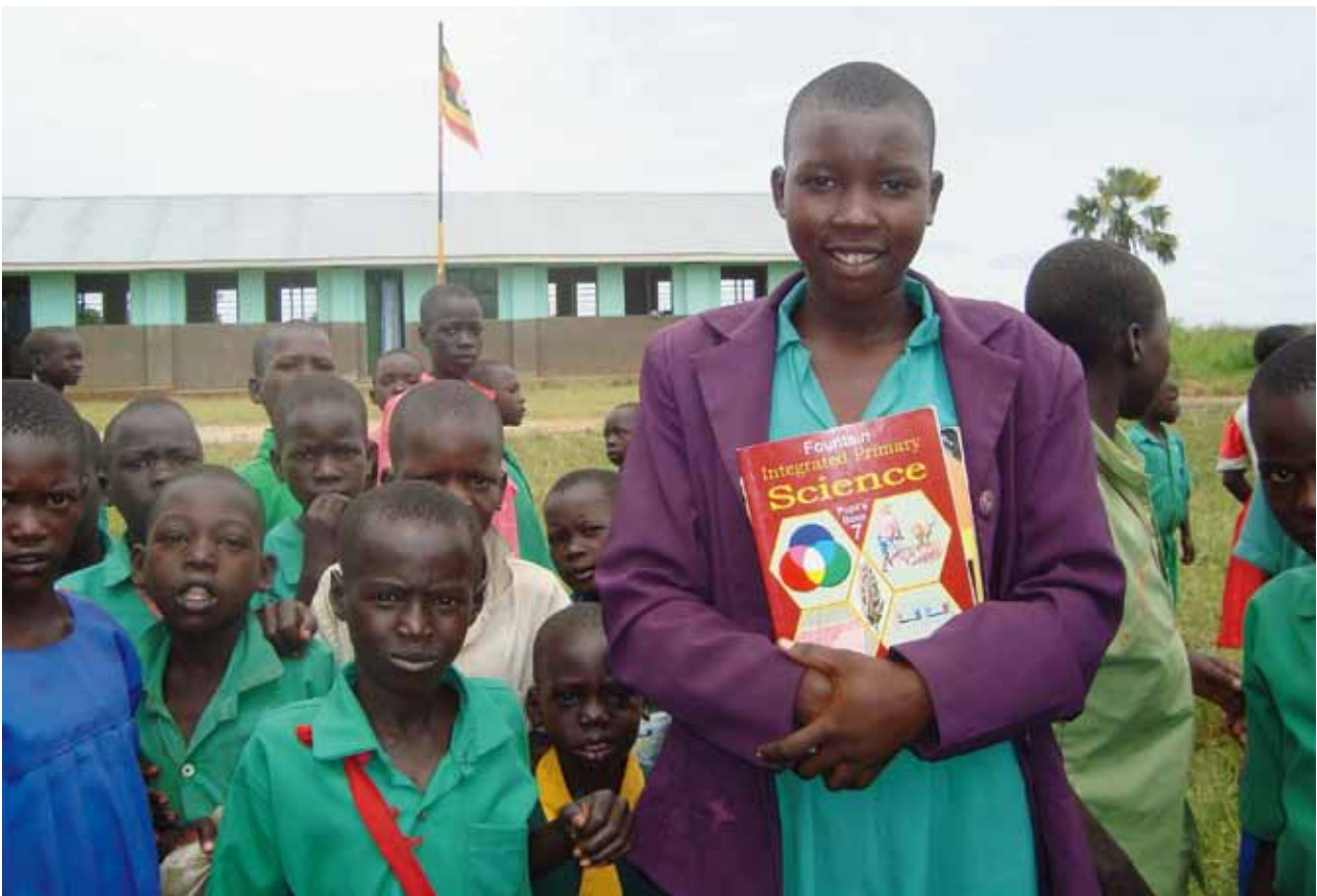
Con el retorno de la paz, las matrículas escolares en el norte de Uganda han aumentado de forma sorprendente.