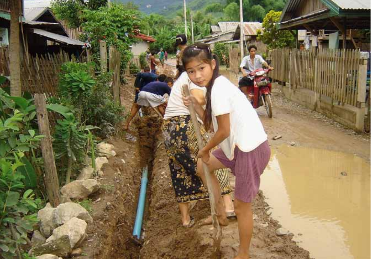
Tradicionalmente, las mujeres y las niñas juegan un papel preponderante en la atención de las necesidades de agua y saneamiento de sus familias y comunidades.