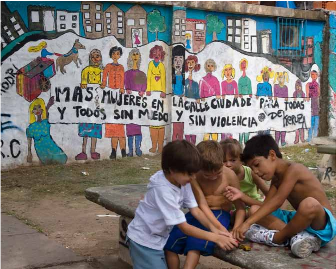
Reclamando espacio público: Mujeres de Rosario, Argentina, pintaron un mural con el mensaje "Más mujeres en la calle: ciudades seguras para todas y todos sin temor y sin violencia."

Tornar a las ciudades más seguras y mejorar los espacios públicos para todos los habitantes es otra área donde ONU-HABITAT promueve las mejores prácticas y la responsabilidad gubernamental. El foco principal se centra en la mejora de la seguridad urbana para los grupos vulnerables y no privilegiados, incluyendo a las mujeres. En el pasado, la mayoría de los programas que hacían frente a la violencia contra las mujeres se centraba en la violencia íntima del compañero en la esfera privada y doméstica. Aunque estos esfuerzos sean importantes, los formuladores de política de hoy en día necesitan abordar también la violencia basada en el género en los espacios públicos.