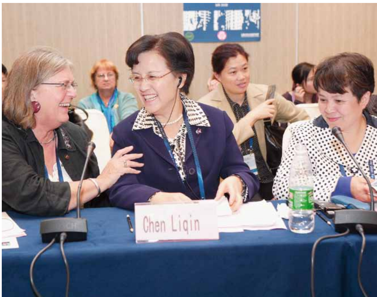
Frente a Frente: ONU-HABITAT utiliza los eventos internacionales de elevado perfil, tal como el Foro Urbano Mundial para reunir a mujeres representantes del gobierno, academia y organizaciones de mujeres de base, para desarrollar estrategias sensibles al género para la planificación urbana.