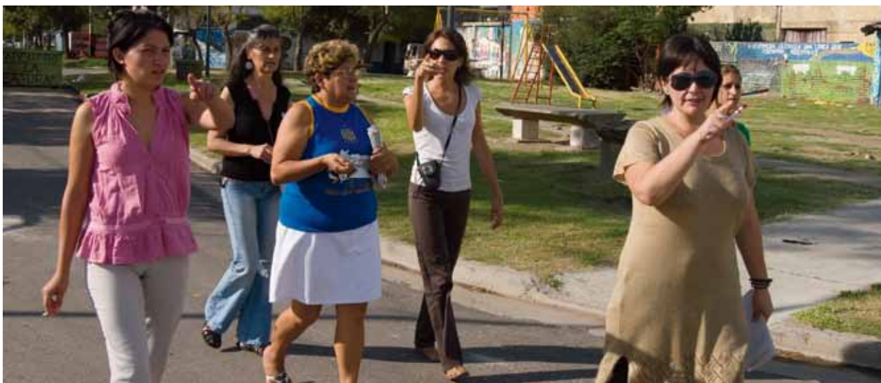
Mujeres realizan una visita exploratoria para identificar riesgos a la seguridad como parte del programa de Ciudades Más Seguras, una colaboración entre UNIFEM y ONU-HABITAT. Foto © Hilary Duffy / UNIFEM, Argentina.