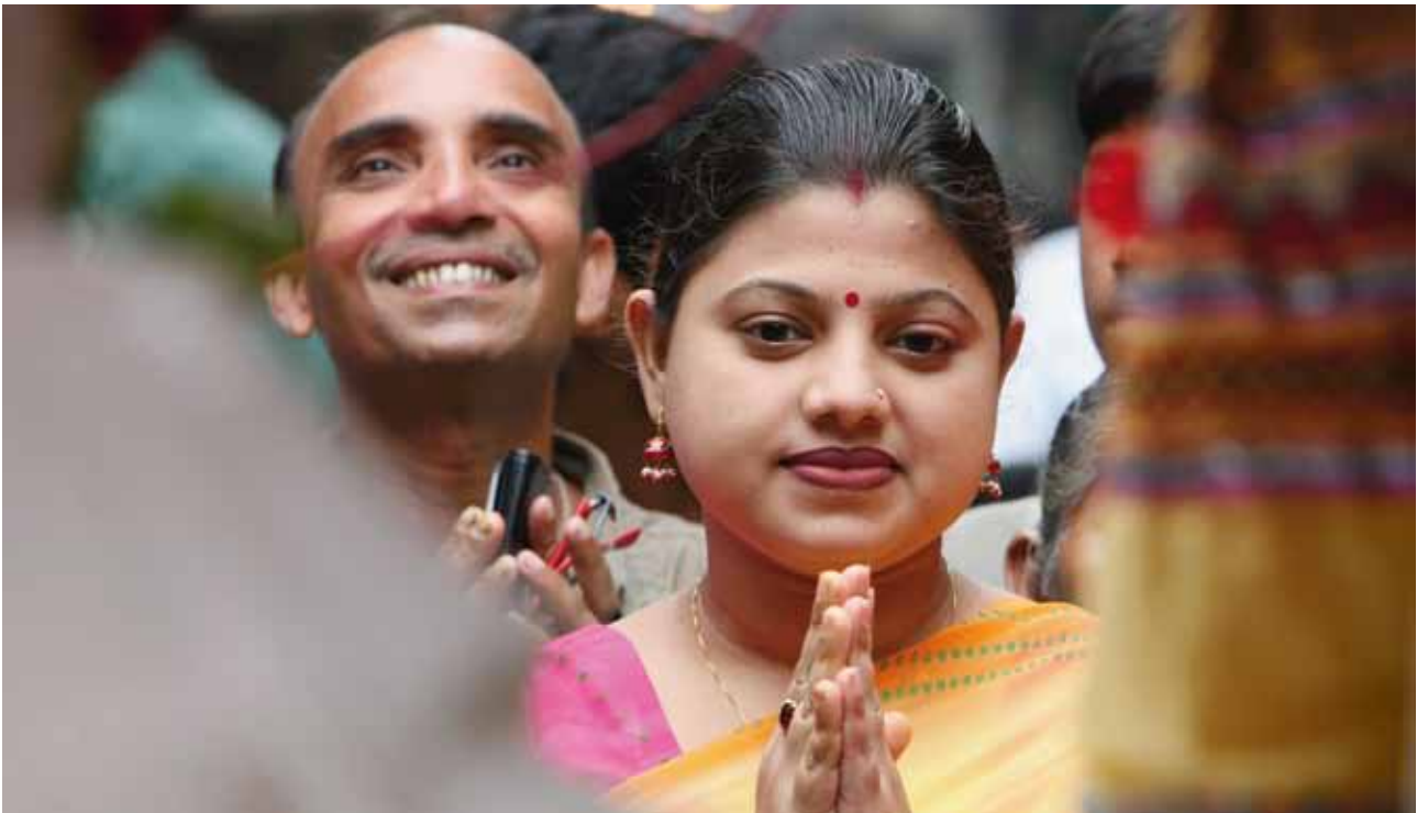
Trayendo el género al foco: ONU-HABITAT está esforzándose para mejorar la compilación y análisis de datos sobre género y ciudades. Foto © Manoocher Deghati / IRIN, Dhaka.

el género. La agencia también compila información sobre cualquier acción tomada por las ciudades, los gobiernos locales y las organizaciones de la comunidad a fin de mejorar la igualdad de género, lo que posibilita compartir las mejores prácticas.